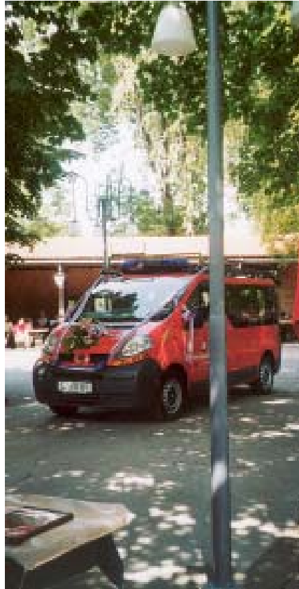
Novo vozilo za prevoz oseb

Skupni pokal ženske-moški so dobili gasilci iz Količevo karton.