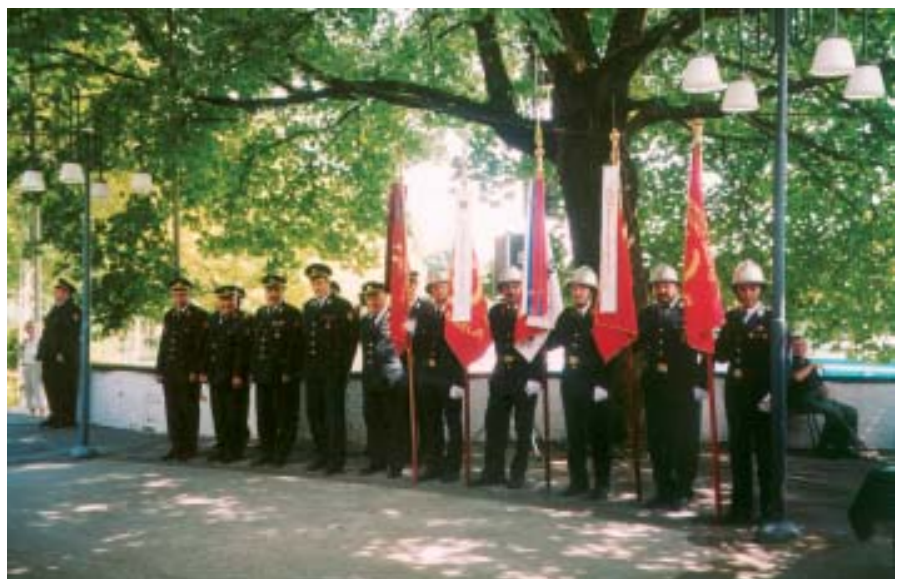
Na pomoč so nam priskočila tudi druga društva