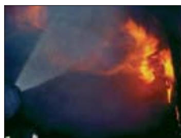
Spodaj: Slika vročega treninga (Hot fire training) Pravičen vstop gasilca

Ljubljanski Gasilec je glasilo gasilcev regije I