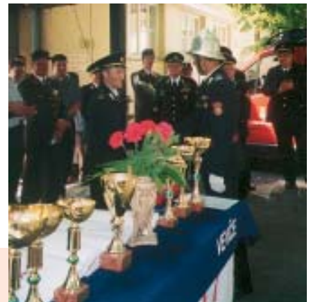
Poveljnik predaja značko za 30 let operativnega dela.