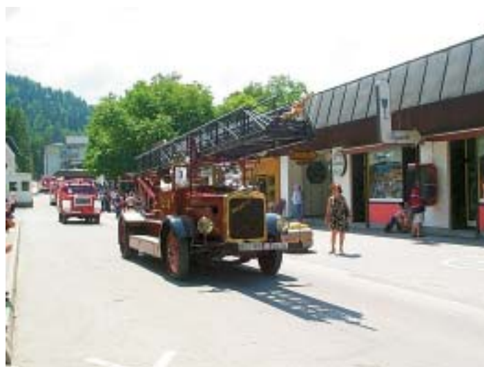
Zgoraj: Slika iz 14. kongresa Gasilske zveze slovenije.